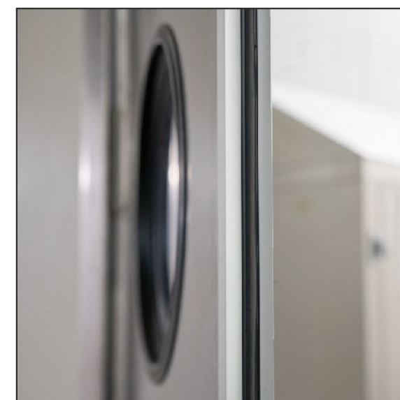
1. Alu + Gasket profil