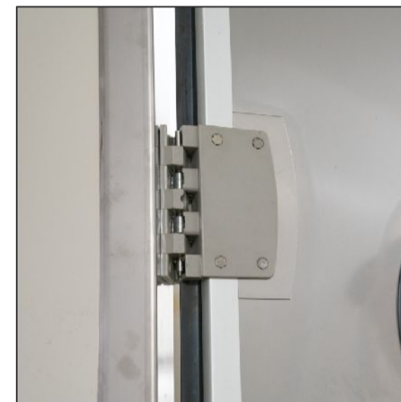
2. Swing door hinges