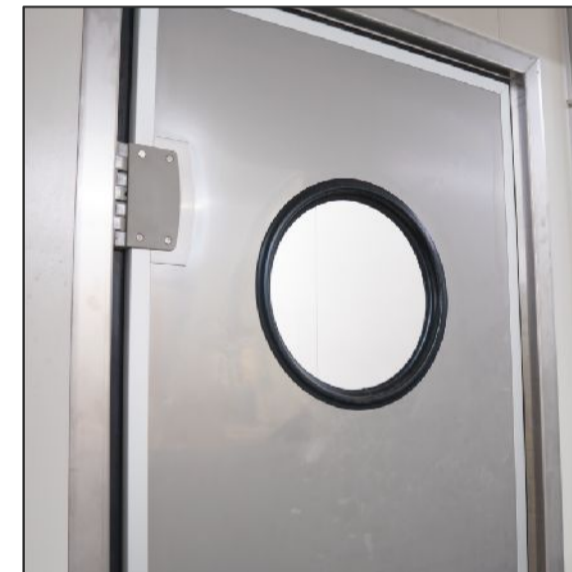
3. Ø350 porthole