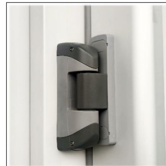
3. Kiemelős zsanérzat