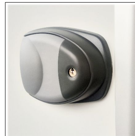
1. Külső kulcsos zár