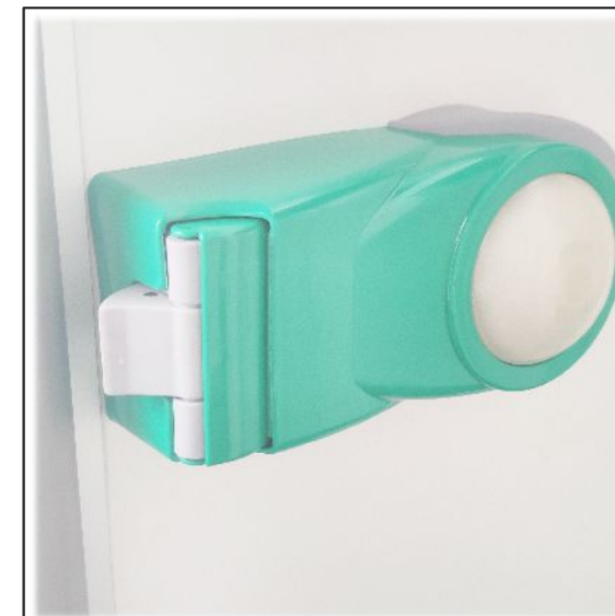
2. Belső biztonsági zár